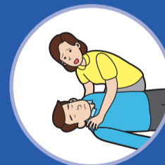
반응 확인 Check for responsiveness