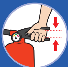
손잡이를 움켜쥐는다 Squeeze handle