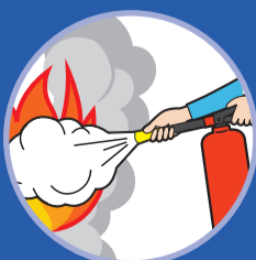
분말을 골고루 쏜다 Sweep side to side