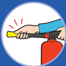
노즐을 잡고 불쪽을 향한다. Aim at base of fire