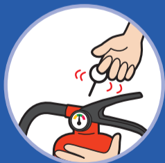
안전핀을 뽑는다 Pull pin