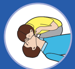
인공호흡 2회 2 rescue breathings

※ 화재발생시 골든 타임 5분, 심정지 환자발생시 골든 타임 4분. 가장 먼저 발견한 사람이 즉시 실시하는 것이 가장 중요합니다.