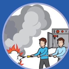
불을 향해 쏜다 Extinguish a fire