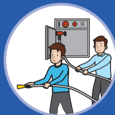
호스를 빼고 노즐을 잡는다 Take out the hose