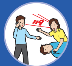
119 신고 및 AED 요청 Call 119