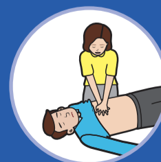
가슴 압박 30회 30 chest compressions